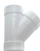
Forquilha 45º Simples Aspiração