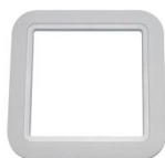
Espelho P/ Tomada