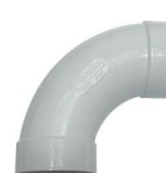
Curva Longa Aspiração F/F 90º