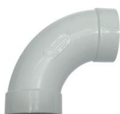
Curva Longa Aspiração M/F 90º