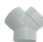
Forquilha Dupla Aspiração