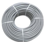
Tubo Anelado C/Fio Eléctrico 100 Mts