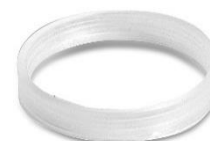
Anilha Vedação Tubo Descarga