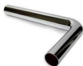
Tubo Descarga Cromado Sanijato