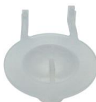
Emboque Corvo Chupeta de Borracha