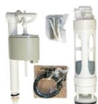
Ferragem Compacta Sinfonada