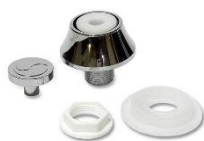
Conjunto Pressão Digital Eursani