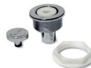
Conjunto Comp. Pressão Digita Eurosani