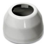
Vista Saída Água Sanijato