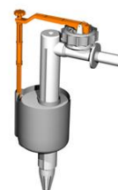
Torneira Bóia Inferior Supra