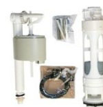
Ferragem Compacta Digital Cromada