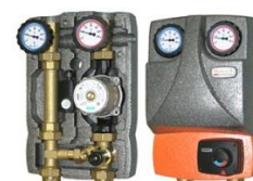
Grupo de Impulsão C/Bomba