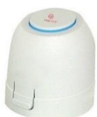
Actuador Eletrotérmico c/contacto auxiliar