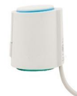
Cabeça Eletrotérmica 2 Fios P/Coletor Latão