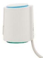
Cabeça Eletrotérmica 2 Fios P/Coletor inox