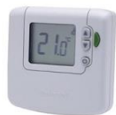
Termostato Digital Control Pav. Radiante